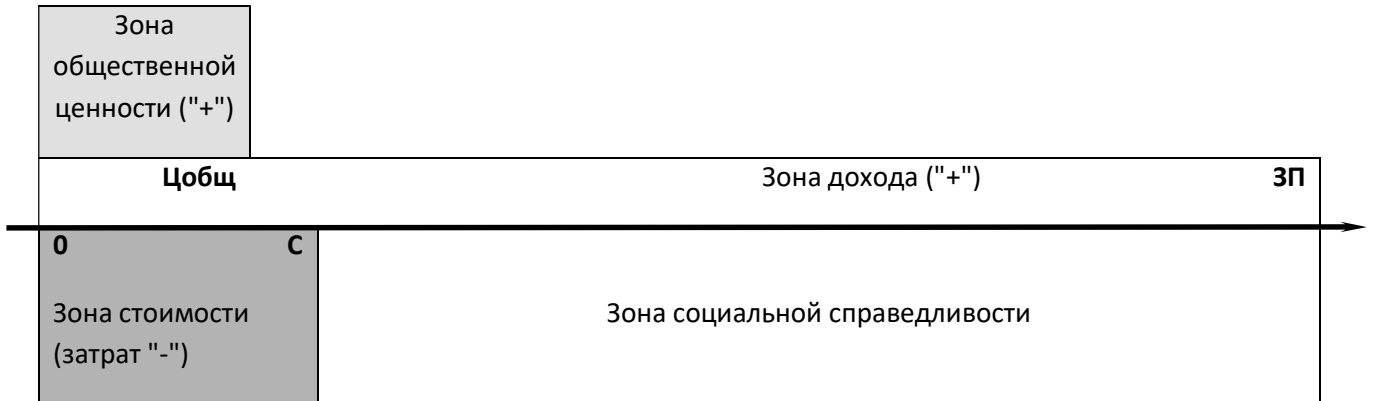
Рис. 4. Диаграмма стоимостей "умеренного" рабовладельца

Нещадная эксплуатация каждого из многих рабов позволяла рабовладельцам накапливать громадные богатства и вести роскошный потребительский и паразитический образ жизни.