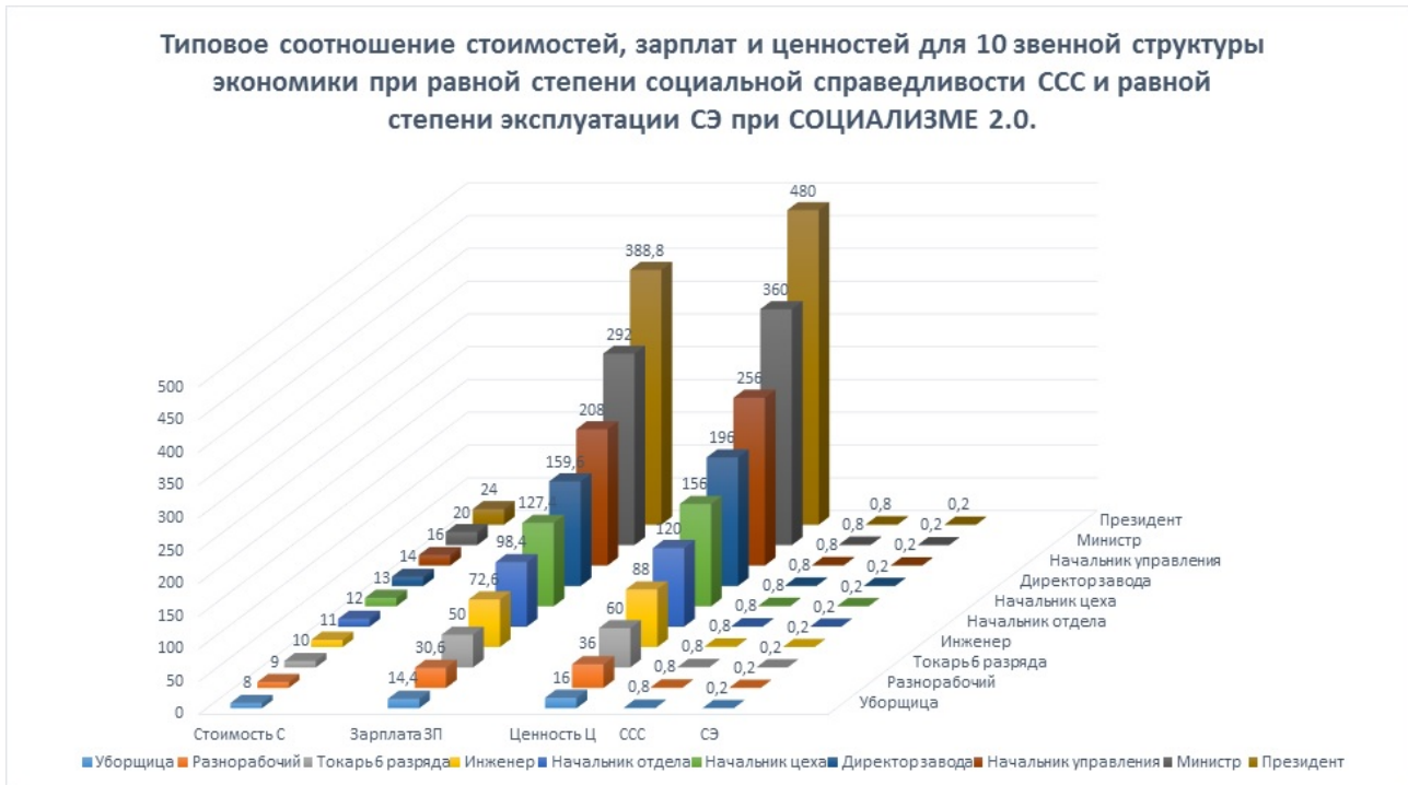
Рис. 2. Отношения стоимости и ценности при социализме 2.0

возрастания скорости этого расширения. Совокупная прибыль народного хозяйства общества образуется из суммы всех индивидуальных прибылей образованных каждым трудящимся членом общества. Каждый трудящийся будет максимальным образом нацелен на образование своей наибольшей прибыли лишь в том случае, если по отношению к нему выплатой заработной платы (вознаграждения за труд) будет реализован равный и наивысший возможный уровень степени социальной справедливости. И наглядно это может выглядеть примерно так.